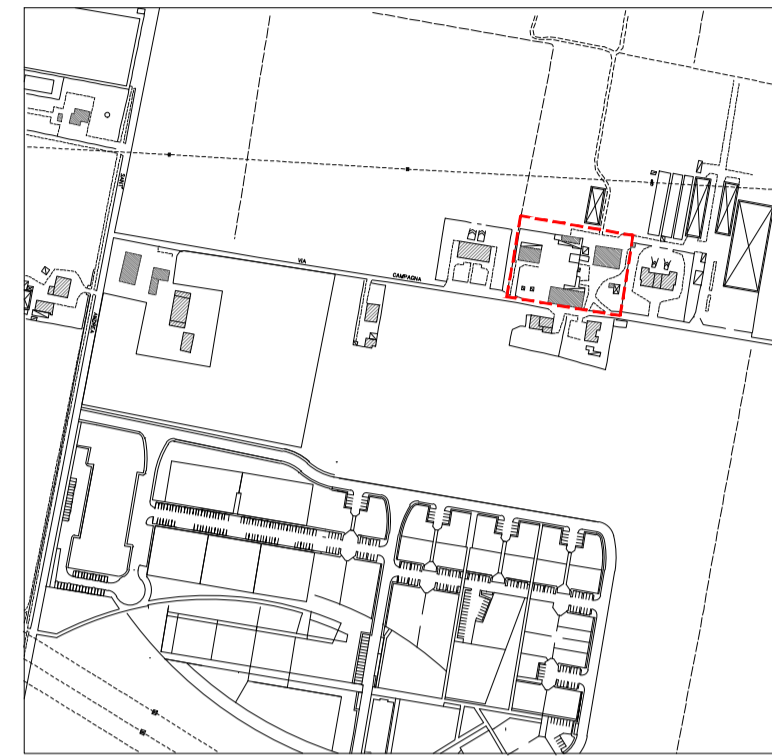
TAV. 1 INGOMBRI STATO ATTUALE

PROGETTISTI : GEOM. PAOLO UGILI ARCH. GIANNI RAFFAELI